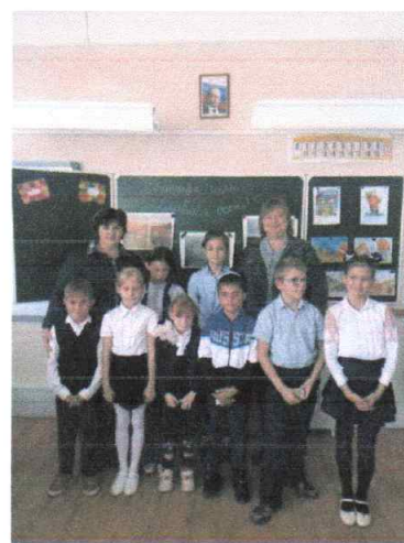
Фото победителей конкурса.