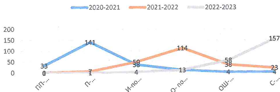
Динамика освоения специально индивидуальной программы развития

Директор ГКОУ школы- интерната ст-цы Полтавской